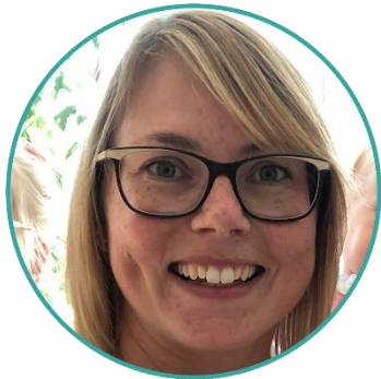
Erzieherin Dipl.-Sozialpädagogin (FH)

Die Jugendsozialarbeit findet in enger Zusammenarbeit mit dem Kollegium der Schule und dem Amt für Jugend und Familie statt.